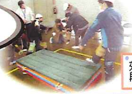
効き足をダンボールで固定段差を越えるのも一苦労!

誰でもチャレンジしたいと思うことに取り組めるよう、できないことは皆で支えあっていくことが大切だと思いました