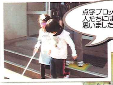
点字ブロックは目の不自由な人たちには大切なものだと思います

アイマスク等で目を隠し、目の不自由な状況の中歩行してみることで目の不自由な方の気持ちを理解する他、目の不自由な方のガイドの仕方学ぶ