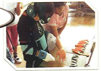
人の優しさ、温かさを分かち合える気がしました

高齢者と同じような状況を装具等装着することで作りだし、普段の生活の一部や歩行を実際に行ってみることで、高齢者の気持ちに寄り添う体験をする