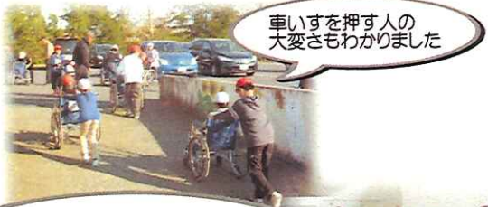
車いすを押す人の大変さもわかりました

足の不自由な方が利用する車いすの操作方法を学んだり、車いすに実際に乗って車いすを利用している方の気持ちを理解する