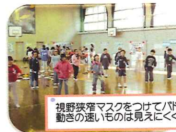
視野狭窄マスクをつけてバドミントン動きの速いものは見えにくくなります