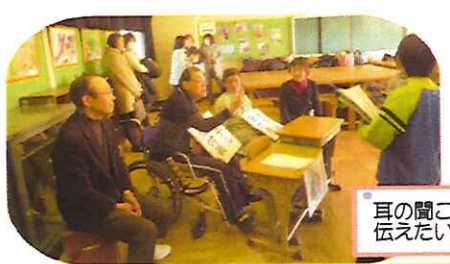
耳の聞こえない世界でお買い物伝えたいのに伝わらないので苦戦!

駅や旅館やお店で言葉が通じなかったら? 海外旅行をした際に言葉が通じないことで不便さを感じるように、生活場面で手話が通じない事での不便さを体感することで、耳の不自由な方の気持ちに寄り添う体験をする