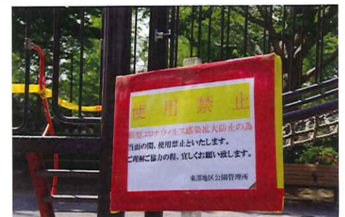
公園の遊具は使用禁止に