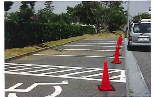
封鎖された公園の駐車場

新型コロナウイルスは私たちの日常生活を一変させました。あらゆる催しが延期や中止になり、夏祭り・盆踊りのない夏を迎えそうです。