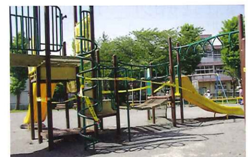
使えなくなった遊具