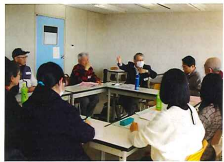
少人数に分かれての分科会風景