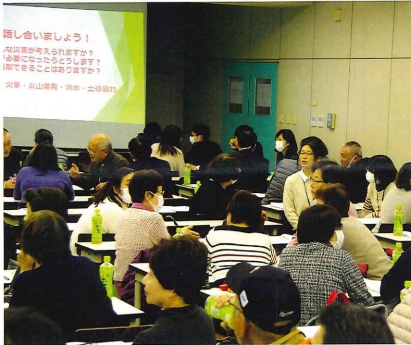
講演中のミニディスカッションタイムで熱く語り合う参加者

話し合いました! 災害が考えられますか? 必要になったらどうします? 助けることはありますか? 火事・火山噴発・洪水・土砂崩れ