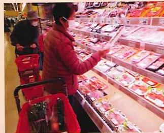
買物代行 おまかせくん

会員は、利用会員144名、協力会員35名、賛助会員88名(令和5年4月現在)。令和4年度の日常生活支援活動は2,240時間になるニャン。