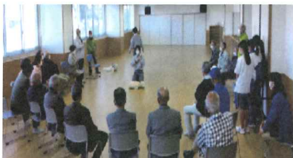
役員研修会 (11月30日 会場 なのはな館)

社協関係者が福祉活動を展開するための知識取得として市消防局から「心肺蘇生法」「AEDの使用法」等を学びました。