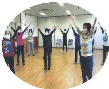
ラジオ体操は健康維持に最適です

なのはな館で、毎週土曜日午前中、全国ラジオ体操連盟公認指導士2名と参加者10数名でラジオ体操の集いをしています。