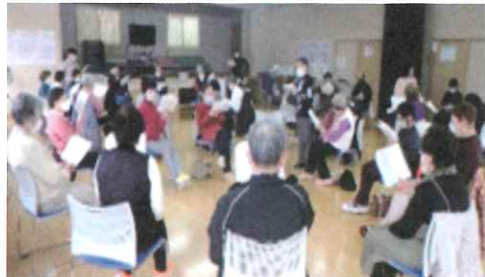
昭和の名曲を合唱

寺谷地区で開催している「ふれあいいきいきサロン」は、高齢者の皆さんなど地域住民の方へふれあい・仲間づくり・健康増進の場を提供し、支え合い、助け合いの芽が広がることをめざしています。寺谷地区では各町会・自治会に分かれ、4会場で2回、年間8回開催しています。また、12月には高齢者の交流を目的に「地区全体茶話会」も予定しています。