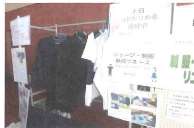
制服・ジャージリユース活動 (牛久Tsunagu)