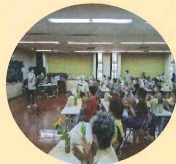
共生型サロン (南総公民館)