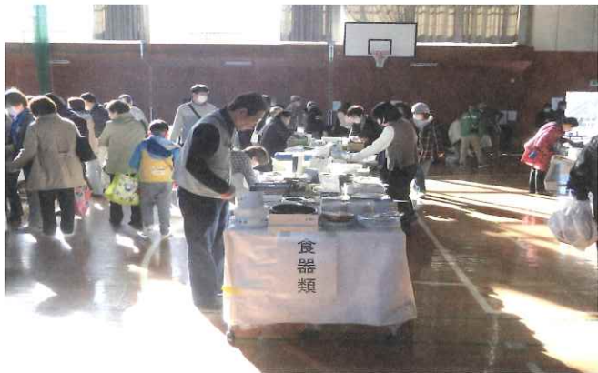
南総地区福祉バザーの様子 (南総公民館)

11月19日(日)4年ぶりとなる福祉バザーが南総公民館体育室にて開催されました。