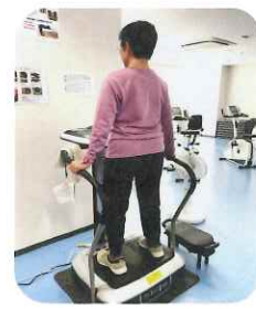
新しいマシン：エアランポリンとパーフェクトボディ