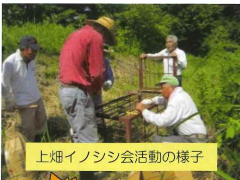
上畑イノシシ会活動の様子