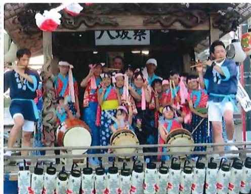
(牛久下町の山車でお囃子をする皆さん)

復活「八坂祭」 コロナ禍で行われなかった牛久「八坂祭」が四年ぶりに、七月二十一日・二十二日の二日間、開催されました。このお祭りは、江戸時代末期から行われていた伝統ある行事です。蒸し暑い中、多数の人達で賑わい、子どものお囃子に皆さん釘付けになりました。