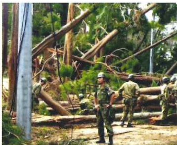
菅の谷台での倒木

9月9日に千葉県に上陸した台風15号は最大瞬間風速が観測史上第1位となる秒速57.5mもの強風の影響で、建物被害や倒木等が多数発生し、停電の長期化や、断水・通信障害など、市民生活や産業活動の多方面に大きな被害が生じる特殊な災害となりました。また、台風19号による被害や、台風21号の接近に伴い10月25日に記録的な大雨に見舞われました。この大雨においても浸水や土砂崩れ等で甚大な被害が発生しました。