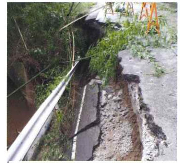
寺谷地区での道路崩壊

日常生活ではあって当たり前の「電気」「水」「通信手段」が断たれた生活は誰もが想像していなかった出来事でした。