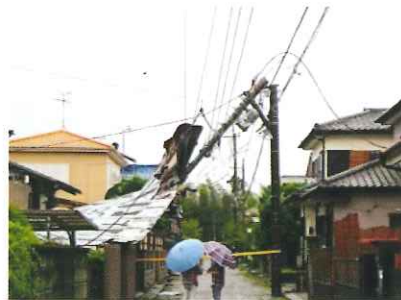
小勝山団地での電柱倒壊