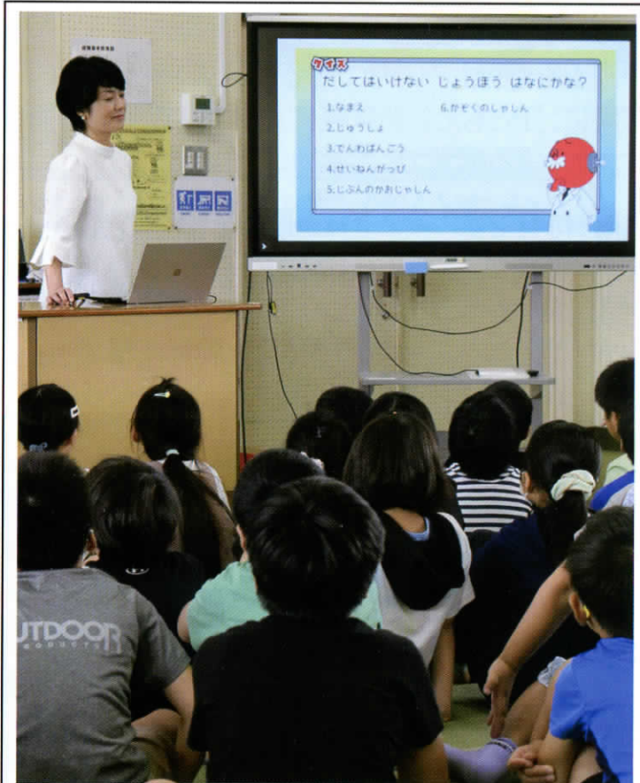
音楽室を使用して学年ごとに実施、写真は4年生の授業。