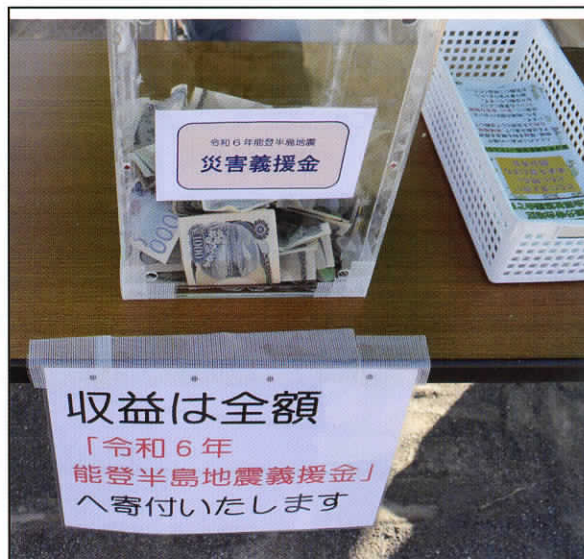
お札での寄付も沢山頂きました。