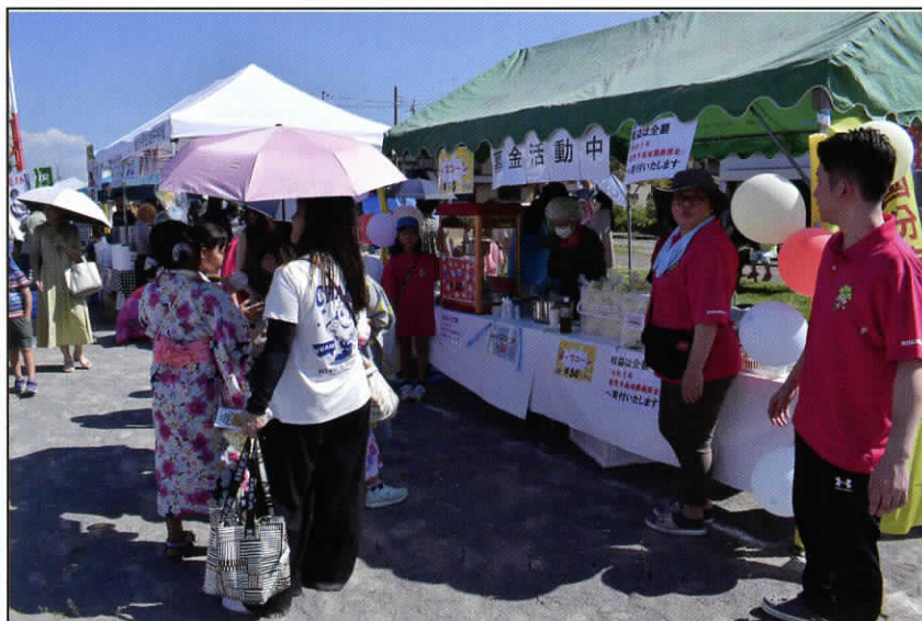
納涼祭での出店状況