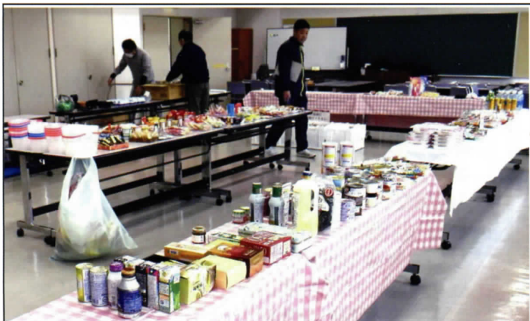
フードパントリー会場の準備状況

下の写真は、2月23日に国分寺公民館で開催したフードパントリーと制服リユースの会場準備状況です。