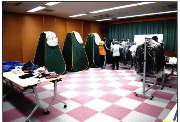
制服リユース会場の準備状況