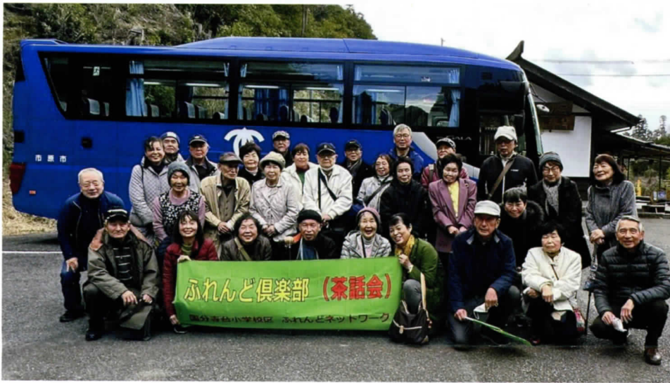
大多喜城駐車場で記念撮影