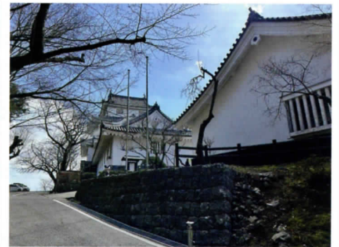
桜開花が待ち遠しい大多喜城