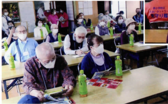
西小学校区 茶話会 (交通安全講話) 2022年10月16日