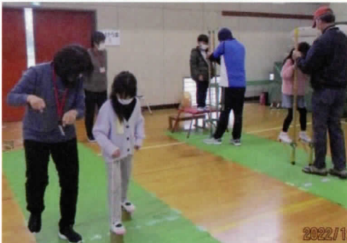
昔遊びを楽しむ会 2022年12月、シルバー友の会と共に、竹馬・羽根つき・こま等、昔の遊びを台小1年生児童と楽しみました 竹馬及び割りばし鉄砲の子供達。