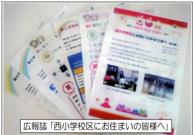
広報誌「西小学校区にお住まいの皆様へ」