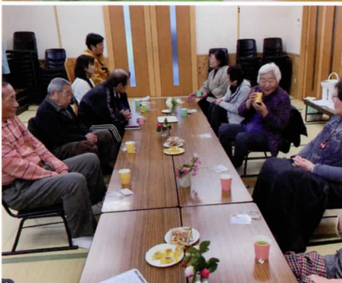
わいわいカフェ 毎月第2・第4木曜日の9時半から南国分寺台町会会館で開催しています。軽い体操や、お茶を飲みながら懇談しています。