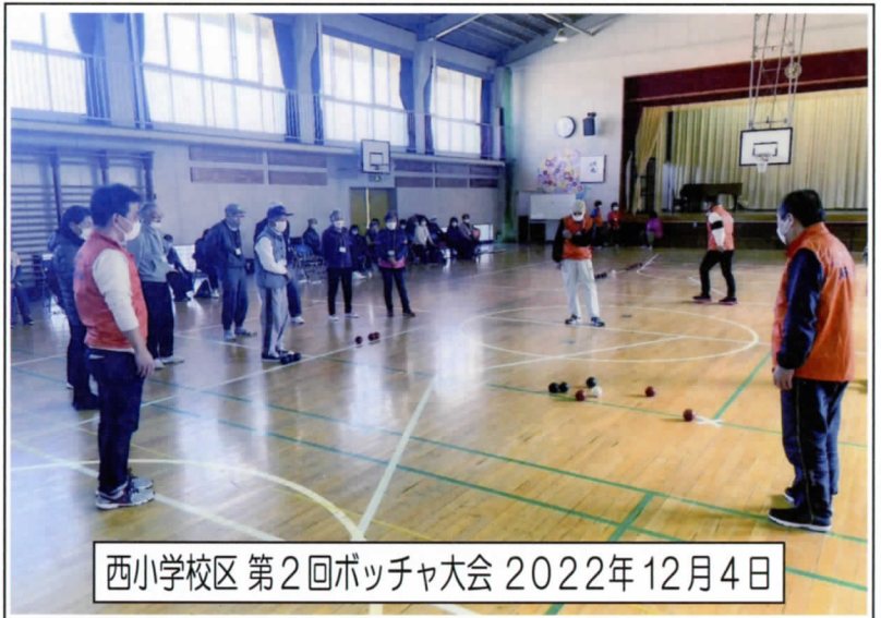
西小学校区 第2回ポッチャ大会 2022年12月4日