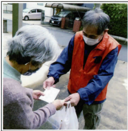
西小学校区 歳末助け合い事業 年賀状配布 2022年1月初旬