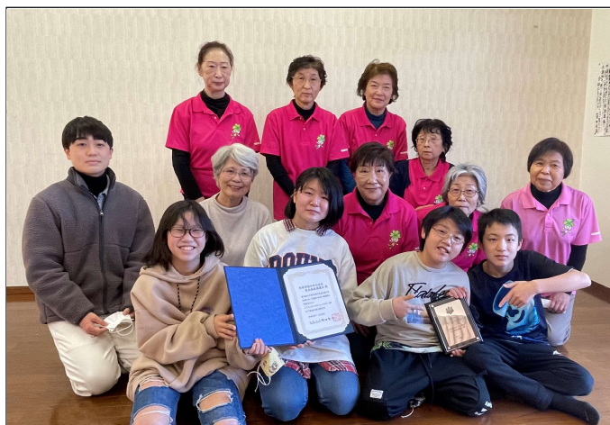
チャイルド・ユースサポート章の表彰状と盾

地区社協では、長年にわたり「支え合いのある地域づくり」を理念として活動を続けています。今回は、「ふれあい子育てサロン」や、小中学生と独居高齢者を対象に食事を通じて世代間で交流し相互の見守り体制を構築する「地域食堂事業」などの取り組みが評価されました。