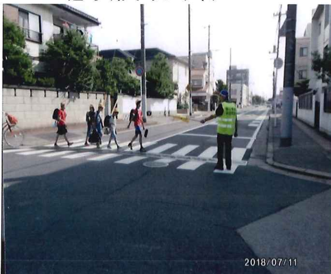
通学路ボランティア