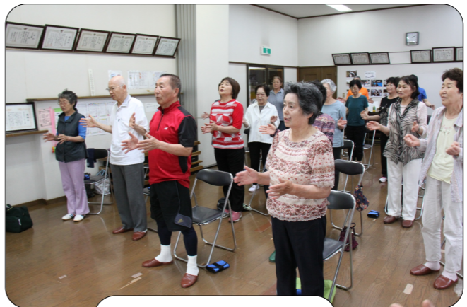
市原いいんばい体操

野菜に含まれるカリウムが塩分を体の外に追い出す作用があり、血圧を下げる効果があります。他に高血圧の原因としてストレスがあります。ストレス解消には趣味や外出に心がけ、また会話をすることが大切です。第二部は「市原いいんばい体操」を行います。