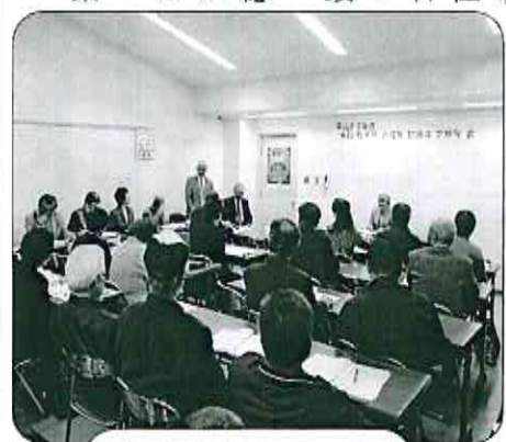
平成27年度定期総会

有秋地区社会福祉協議会では、有秋地区の困っていることを協力して助け合って地域をより良くしていこうと活動しています。