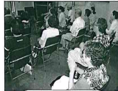
みんなで健康体操

お問い合わせ先 アネッサ (62) 8601 有秋公民館 (66) 0121 有秋支所 (66) 0070