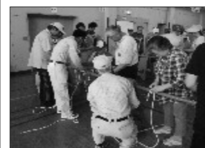
いざという時に！ ロープワーク習得中!