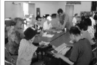
新聞スリッパ作成中