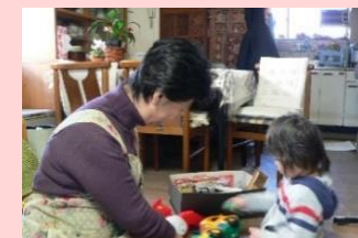
いちほらファミリーサポートセンター