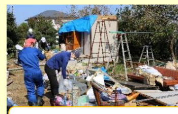
災害ボランティア活動