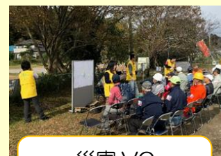
災害 VC 市津サテライト

児童・生徒に対する福祉教育、地域の福祉力を高めるための福祉教育、生涯学習としての福祉教育を推進します。