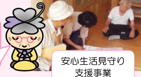
安心生活見守り支援事業