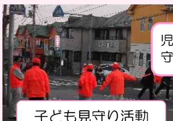
子ども見守り活動