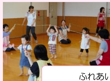
ふれあいサロン事業

市内の各地区において、11の地区社協、44（46小学校区）の小域福祉ネットワークが、それぞれ地域特性を活かした事業を展開しています。