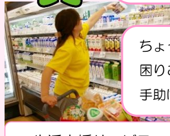
生活支援サービス

—ふれあいサロン事業— 子育て中の方や高齢者等に対して、地域住民やボランティアの参画を得て、市内各地区においてふれあいの場や仲間づくりの場を提供しています。