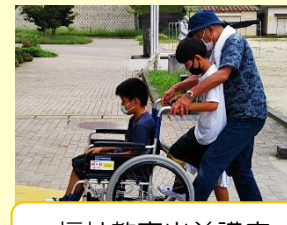
福祉教育出前講座