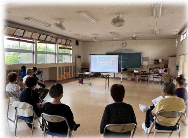
明神 NW「防災学習会」の様子