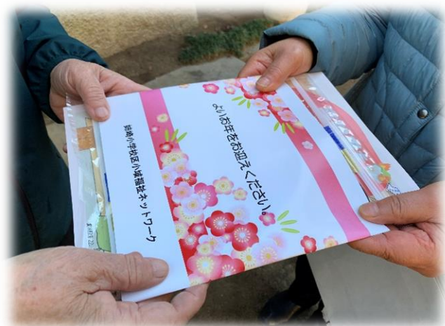
姉崎 NW「よいお年をプロジェクト」 高齢者の見守り活動の様子