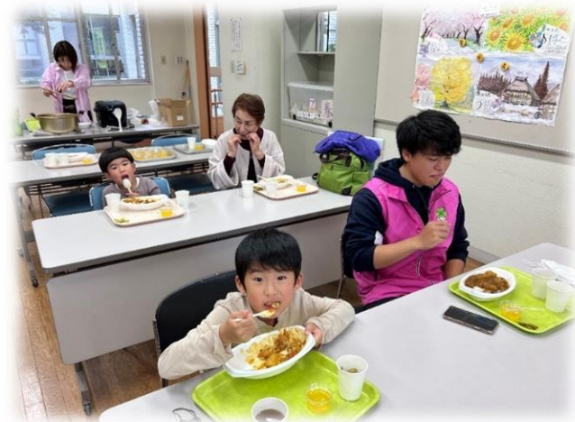
写真：地域食堂「げんき食堂アネッサ」の様子