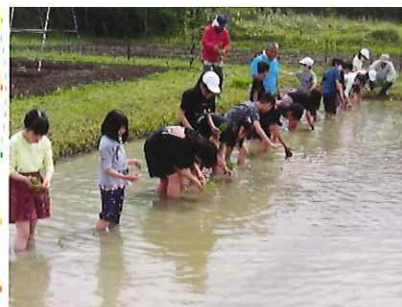
(牛久小児童の田植え風景)

皆吉・金沢・志保井・薮第一資源保全隊は、牛久小学校の体験学習の一環として、五月十四日に五年生を対象に「実習田」で田植え作業の協力をしました。早苗を片手に子どもたちは、歓声をあげながら横一列に並び植え始めました。秋になり実を収穫する楽しみを味わうことができました。 六月五日には、一年生を対象に「コスモス」の休耕田に「コスモス」の種まきを行いました。