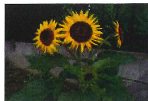
夏の大輪 ひまわり