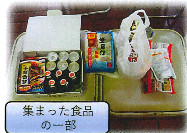
集まった食品の一部