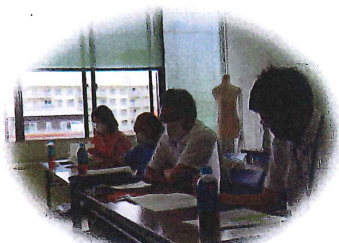
高齢者部会 7月16日 五井公民館にて