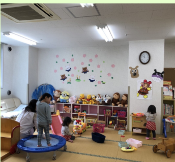
4月から2年ぶりに再開