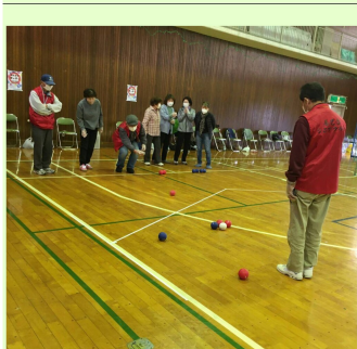
みんなでポッチャ

球・カローリング」の4つのブースに分け、初めての競技に皆さん興味津々。久しぶりにお会いする会員さんに自然と笑みがこぼれ、お互い元気に過ごしている様子に会話も弾み、楽しいひと時を過ごしていました。サークル活動も再開していきます。興味のある方はご連絡ください。