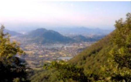
【 遍路みち山あいから、はこんな眺望も 】

な知識の習得に専念した。実機による訓練は、T34型と呼ばれるプロペラ機だった。この訓練では、飛行時間15時間以内に単独飛行の認定が得られなければパイロットへの道が閉ざされる厳しさもあった。