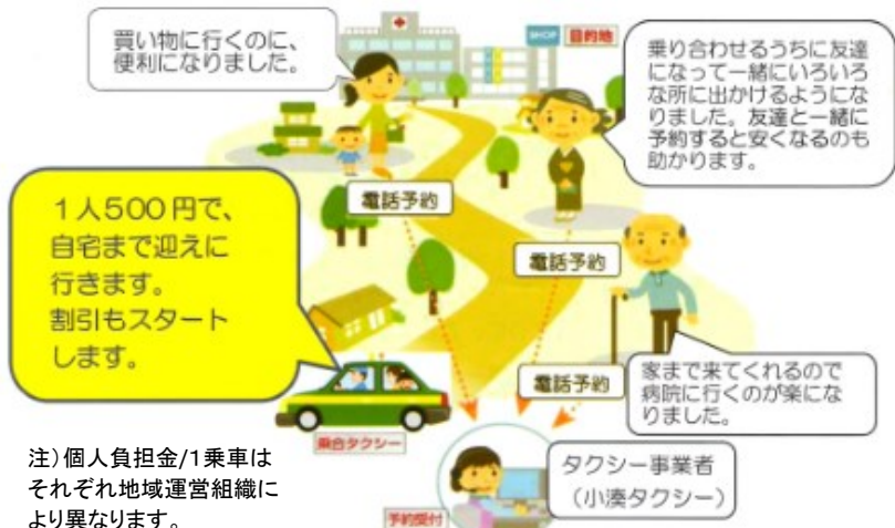
デマンドタクシーのイメージ図

三和地区の高齢化率は、加茂・南総につぎ3位(40.2%・65歳以上)と高い。当然、運転免許返納年齢層も相対的に多い。一方、車に替わる公共交通インフラは未整備と言える。今回、市が提唱するデマンドタクシーについて考えてみる機会を提供したい。